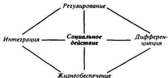
Рис. 2. Социальные функции действия / взаимодействия

раздам), а другой - к социальным субъектам (индивидам, общностям). На стороне культуры формируется функция идентификации индивида с соответствующими ценностями, нормами, которые индивид усваивает в процессе социализации (реализуя соответствующие потребности) и которые только и делают возможным его мышление и общение, в том числе при решении конкретных задач жизнеобеспечения. На другой, социальной стороне оси коммуникации представлена функция взаимодействия индивида с другими социальными субъектами (индивидами, общностями), удовлетворяющая интеракционистские потребности человека и реализующаяся путем включения homo activus в ближайшую статусно-ролевую дифференциацию, а через нее - в социальную структуру общества в целом. Все функции социального действия взаимосвязаны, так что любой его аспект четырехфункционален.