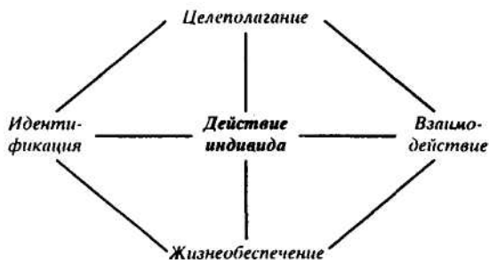
Рис. 1. Функции социального действия индивида

Не до конца ясным остается, как возник в сознании Парсонса методологический синтез в виде четырехфункциональной парадигмы. Имеются указания на то, что отправным ее пунктом послужила социально-бихевиористская схема "четырех желаний" или потребностей У. Томаса: потребность в безопасности, в новом опыте, в признании, в эмоциональном отклике [см. 6; 7, с. 240]. Это и не удивительно, поскольку социальное действие и социальное поведение - близнецы-братья.