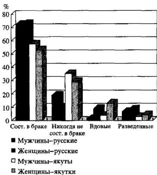
Рис. 2. Распределение по брачному состоянию якутов и русских (в % от общей численности, по данным переписи населения 1989 г.)

А в Нижнеколымском улусе (районе) доля детей, родившихся вне зарегистрированного брака, достигла 61,9%.