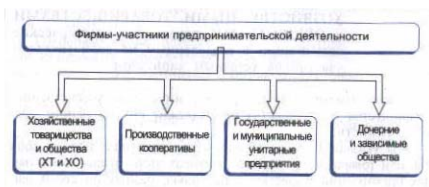
Рис. 6-2. Δ Четыре группы фирм.

Читая и слушая рекламные объявления, разглядывая фирменный бланк или упаковку товара, мы обнаруживаем, что название фирмы включает в себя обязательно какую-нибудь аббревиатуру — «АО», «ПК», «ГП» или латинские буквы «Ltd», «AG», «GmbH» и другие. Это обозначает не что иное, как характеристику организационно-правовой формы предприятий. В нашем примере это «Акционерное общество», «Производственный кооператив», «Государственное предприятие». «Общество с ограниченной ответственностью». Российское законодательство различает десять различных типов фирм, которые отличаются друг от друга по формам собственности, составу, участию в работе фирмы, характеру материальной ответственности, распределению доходов. Чтобы разобраться в этих особенностях, удобно сначала разделить все типы предприятий на четыре крупные группы (см. рис. 6-2).