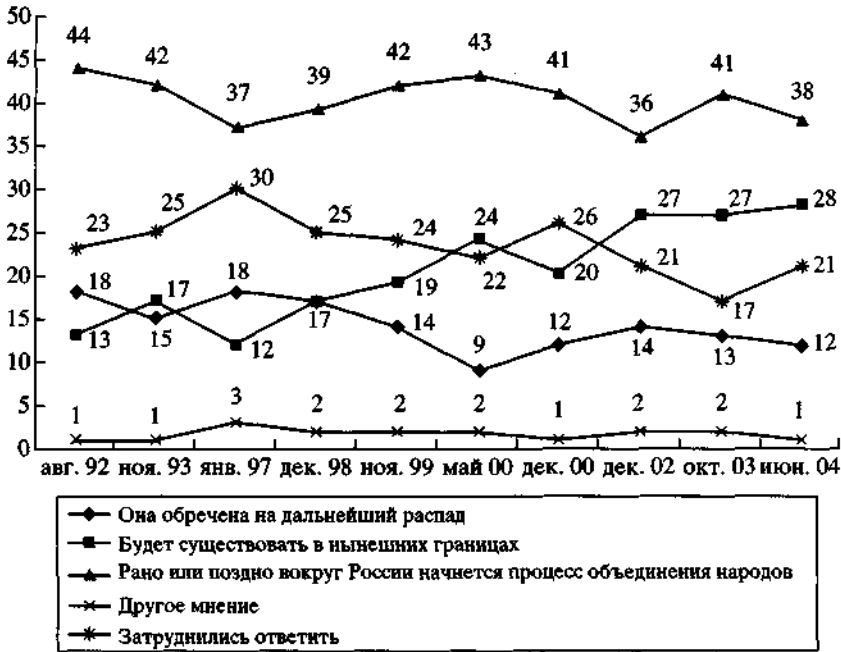
График. Мнение респондентов о будущем, которое ожидает Россию (в % от числа опрошенных)

лизм" становится не столь очевидной для современного массового политического сознания. Что касается экспертов, то их мнение несколько отлично. На 10% меньше число экспертов, которые хотели бы жить в социалистическом обществе. На столько же больше их хотели бы жить в другом. В каком? Ответ на этот вопрос отчасти дает следующий индикатор (см. табл. 4).