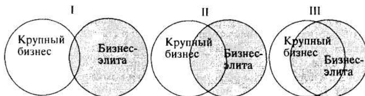
Рис. 2. Этапы формирования бизнес-элиты. I - первый этап: бизнес-элиты еще далека от крупного бизнеса (1993); II - второй этап: бизнес-элиты контролирует около половины крупного бизнеса (1996); III - третий этап: бизнес-элиты контролирует большую часть крупного бизнеса (2001)

сельской местности и малых населенных пунктов. Причина большей провинциальности группы кроется в структурных изменениях - на место влиятельных московских финансистов пришли региональные промышленники. Характер образования бизнес-элиты также претерпел некоторые изменения. Если в 1993 г. типичным был приход в бизнес из сферы науки (26 чел.), культуры и образования (15), из госбанков (17), то в 2001 г. это в основном производственники - 50 чел. (35 в 1993 г.), 16 чел. пришли из структур госслужбы, 28 работали в свое время в сфере науки, культуры и образования. И хотя доля людей с высшим образованием практически не изменилась (94% в 1993 г. и 97 - в 2001 г.), в 2001 г. среди них преобладают люди с техническим или инженерно-экономическим образованием - 73 чел. (в 1993 г. - 55), экономическое и юридическое имеют 57 чел. (ранее 44). У многих второе юридическое образование. Если два высших образования в 1993 г. имели 2,6%; то в 2001 г. таких было 13,4% [10].