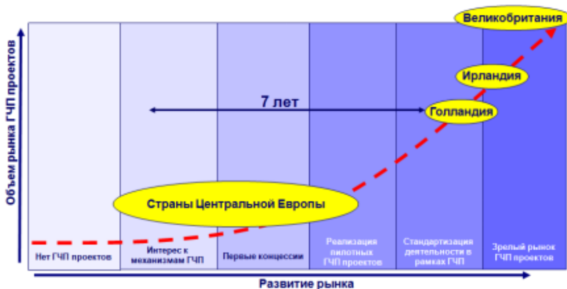
Рис. 2. Модель развития рынка ГЧП 3