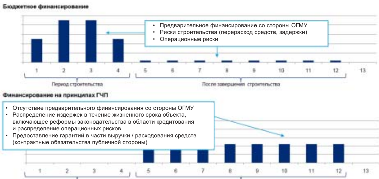
Рис. 3. Преимущества инструментов ГЧП при строительстве объектов социального назначения 4

3. Guidebook on promoting good governance in public-private partnerships / United Nation Economic Commission for Europe, United Nations. New York ; Geneva, 2008.