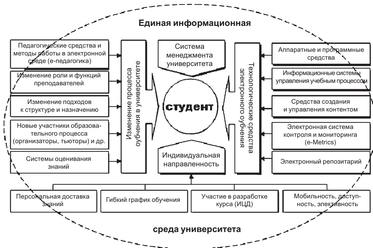
Рис. 2. Коммуникативно-интегрированная система управления и организации учебного процесса

адаптация выпускника к работе в современных условиях только с применением электронных технологий. Концепция основывается на следующих положениях: