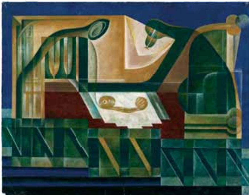
К. Н. Редько. Материнство. 1922–[1925] (Ргали)

Сегодня Бейрут не имеет себе равных в арабском мире в качестве города контрастов. Он соединяет в себе элегантность Стамбула 1 с обшарпанностью Танжера и все еще обещает оправдать изначальное значение слова «Левант» («восход») — места, где люди всех вероисповеданий собрались вместе, чтобы процветать в мирном сосуществовании.