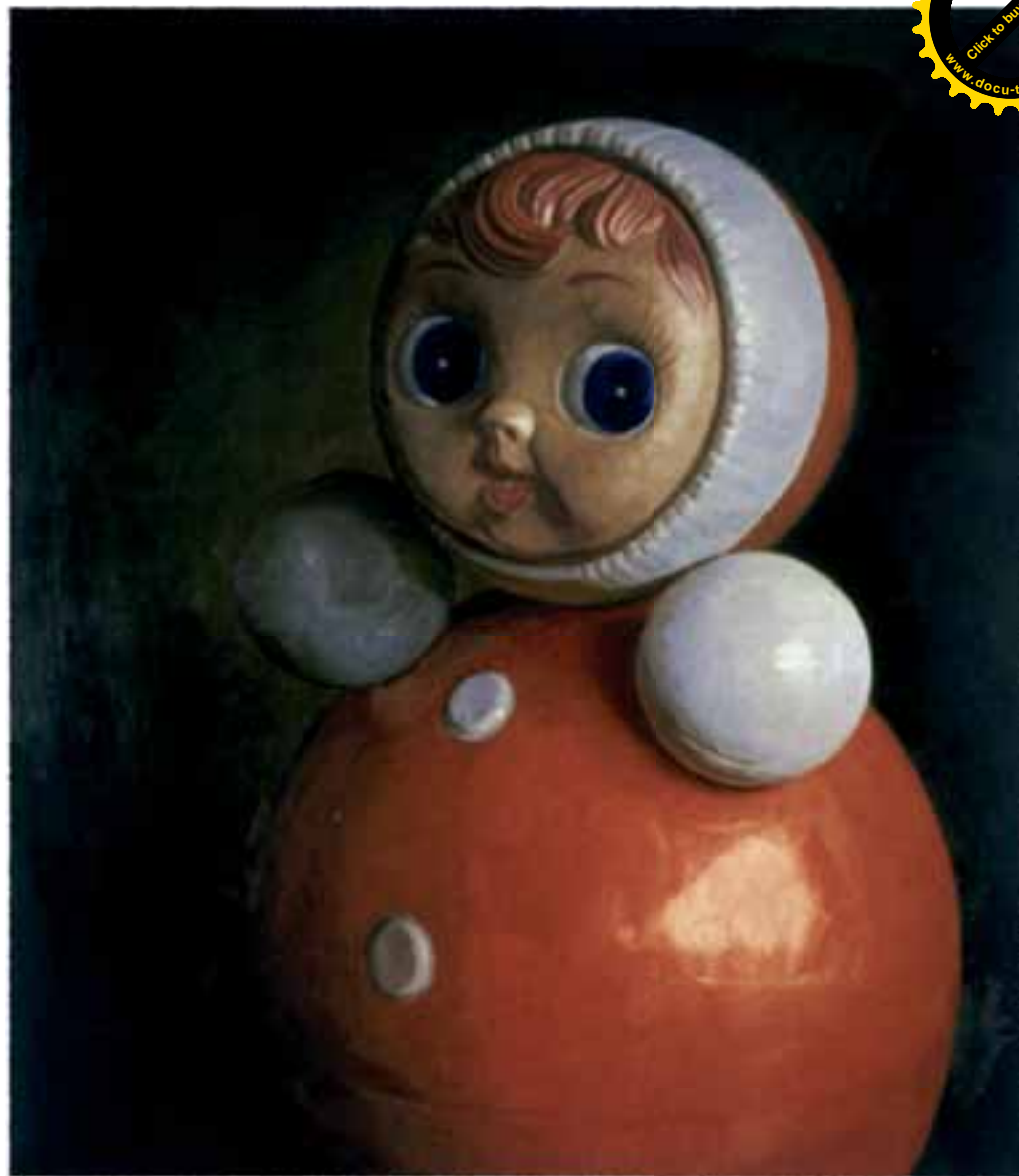
Егор Дмитриев. Неваяшка. 2002. Холст, масло

Кем работают люди в России и на что они реально живут? В точности это неизвестно никому. Пока экономика была государственной, сохранялась теоретическая возможность это выяснить. Сейчас образовались огромные, закрытые для постороннего глаза пространства коммерческой деятельности. Государственный сектор разделился на разнообразные условия, основную часть доходов которых составляет рента, а не зарплата. Где же сохранилась возможность социальной мобильности? Современный школьник задает себе кантовский вопрос: «На что я могу надеяться?» Читая всю эту чушь в дневнике, четко понимаешь, что ответа на него не знает никто. «Учиться, учиться и учиться!» А как же смысл или хотя бы цель? Калькулятор в лотерею выиграть? ■