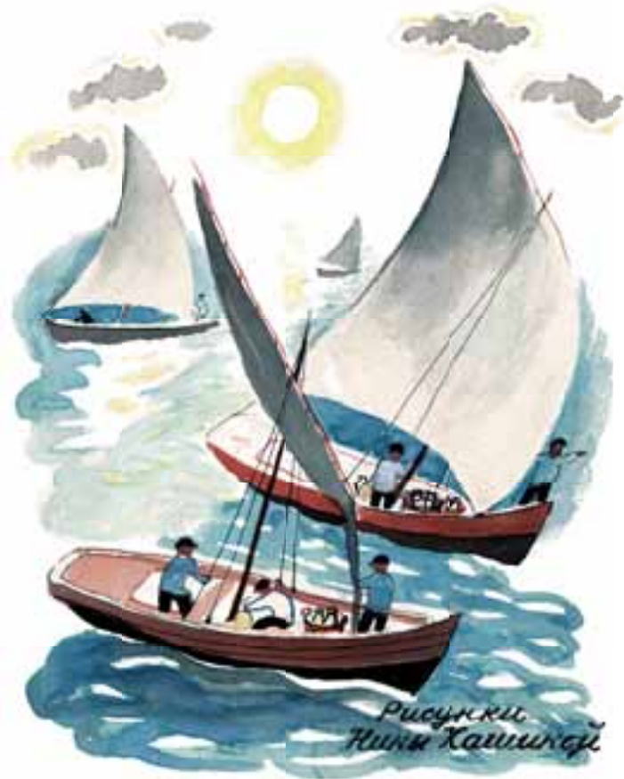
Н. В. Кашина. Рисунок. 1930-е. (РГАЛИ)

В «Отрицании отрицания» приводятся доказательства того, что жертвами Холокоста стали 6 млн человек, а не меньше, как утверждают некоторые. Не знаю ни одного человека, который бы в здравом уме утверждал, что в фашистской Германии не уничтожали евреев. Уничтожение одной группой граждан другой группы своих невиновных соотечественников — преступление. Уничтоже-