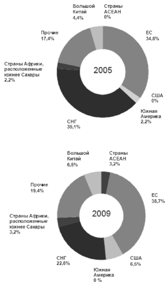
Диаграмма 2: Российские компании за рубежом