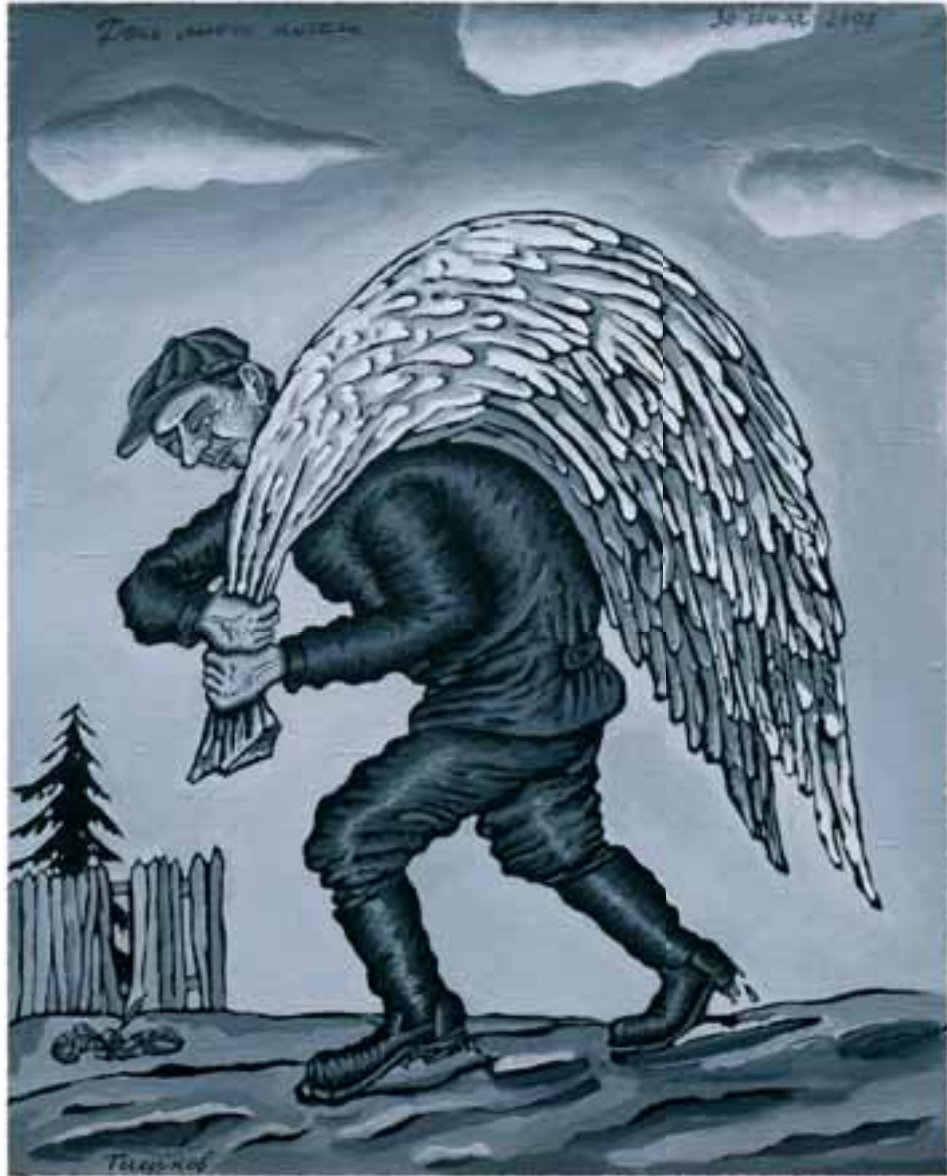
Леонид Тышков. День моего ангела. 2008. Холст, акрил

го времени на такое усиление государства, которое вредно для текущего состояния демократии, одновременно Путин осуществлял действия, которые «со временем будут способствовать демократизации России». В частности, хотя «на Кавказе он предоставил военным опасно широкую самостоятельность», Путин