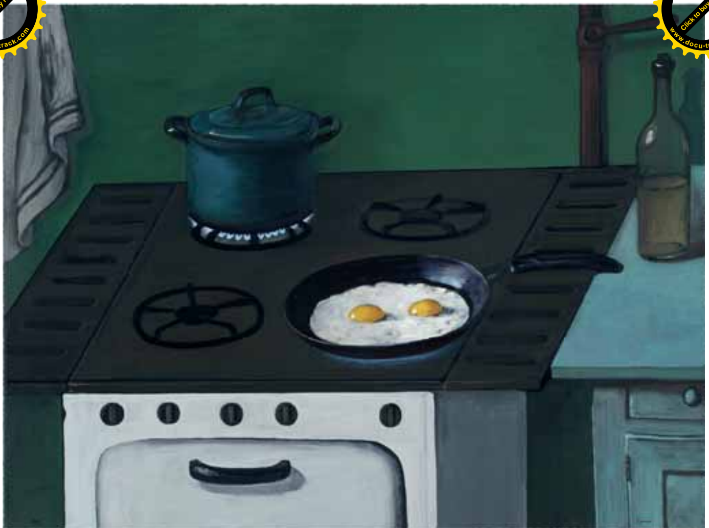
Виктор Пивоваров. Из серии «Едоки лимонов». 2005. Холст, масло

мерение. Речь не идет об отрицании страшного характера многих его поступков. Я, однако, настаиваю на том, что Сталин был более обыкновенным, чем представляют себе его преданные сторонники или же те, кто однозначно осуждает его... Моя книга — не список злодеяний Сталина, а попытка лучше понять его личность». Попытка, на мой взгляд, в целом удалась, хотя и оказалась не лишеной ряда слабых мест.