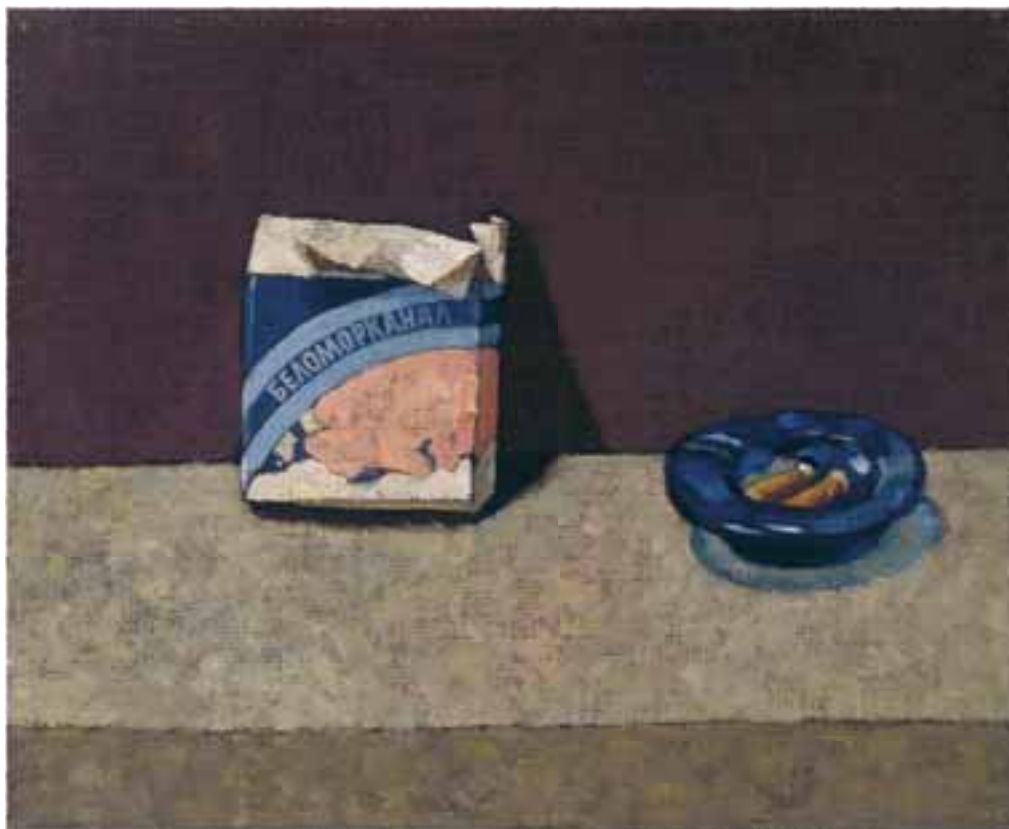
Виктор Пивоваров. Пачка «Беломора». 1991. Холст на оргалите. масло. 40,5 × 49