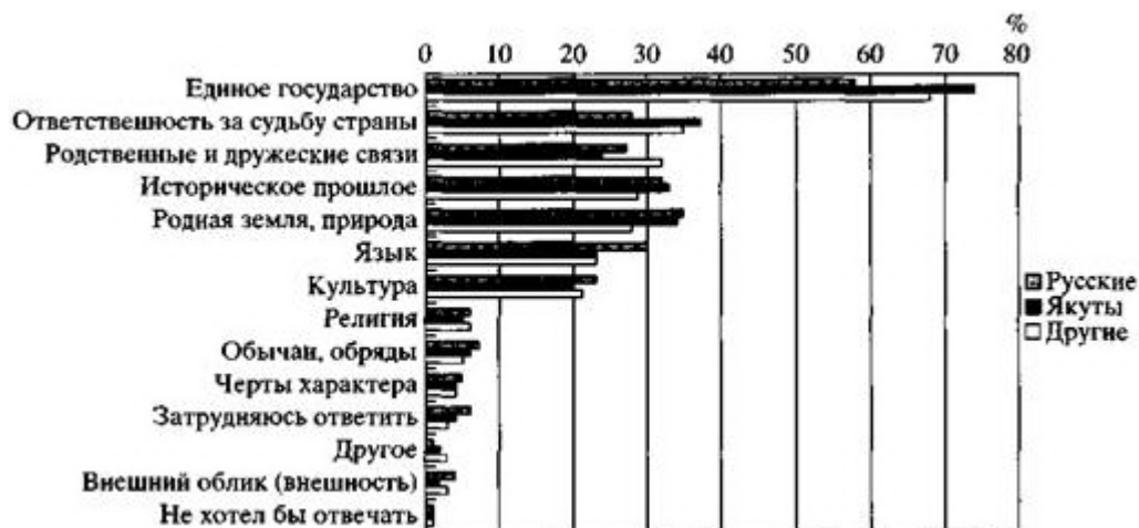
Рис. 2. Рейтинги факторов российской общегражданской консолидации населения Республики Саха (Якутия).

Россией как с территориальной общностью, для них при этом отнюдь не меньшую, а даже несколько большую важность представляют категории "государственное единство" и "ответственность за судьбу страны".