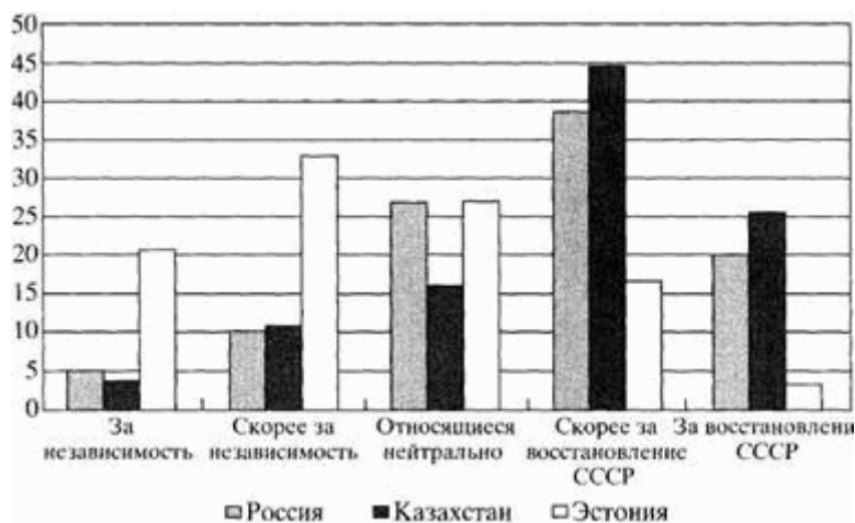
Рис. 2. Гистограмма распределения респондентов трех стран по классам типологии "отношение к независимости".

чае с коммунистической идеологией, на момент 1998 г. нельзя говорить о полной победе идей независимости в политическом сознании граждан трех стран. Очевидно, что все еще сильна ностальгия по советскому прошлому, однако предпосылки к этому в каждой из стран свои.