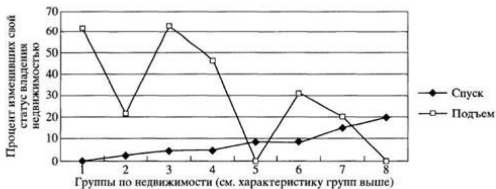
Рис. 1. Динамика владения недвижимостью (в процентах к числу ответивших по каждой из типологических групп) по опросу ноября 2002 г.

Шкала ординат обозначает процент опрошенных, изменивших свой статус как владельцев недвижимого имущества в 2002 г. по сравнению с кануном реформ (1988 - 1990 гг.). Эти данные приведены в разрезе 8-ми типологических групп, выделенных по объему владения недвижимостью на момент опроса 2002 г.