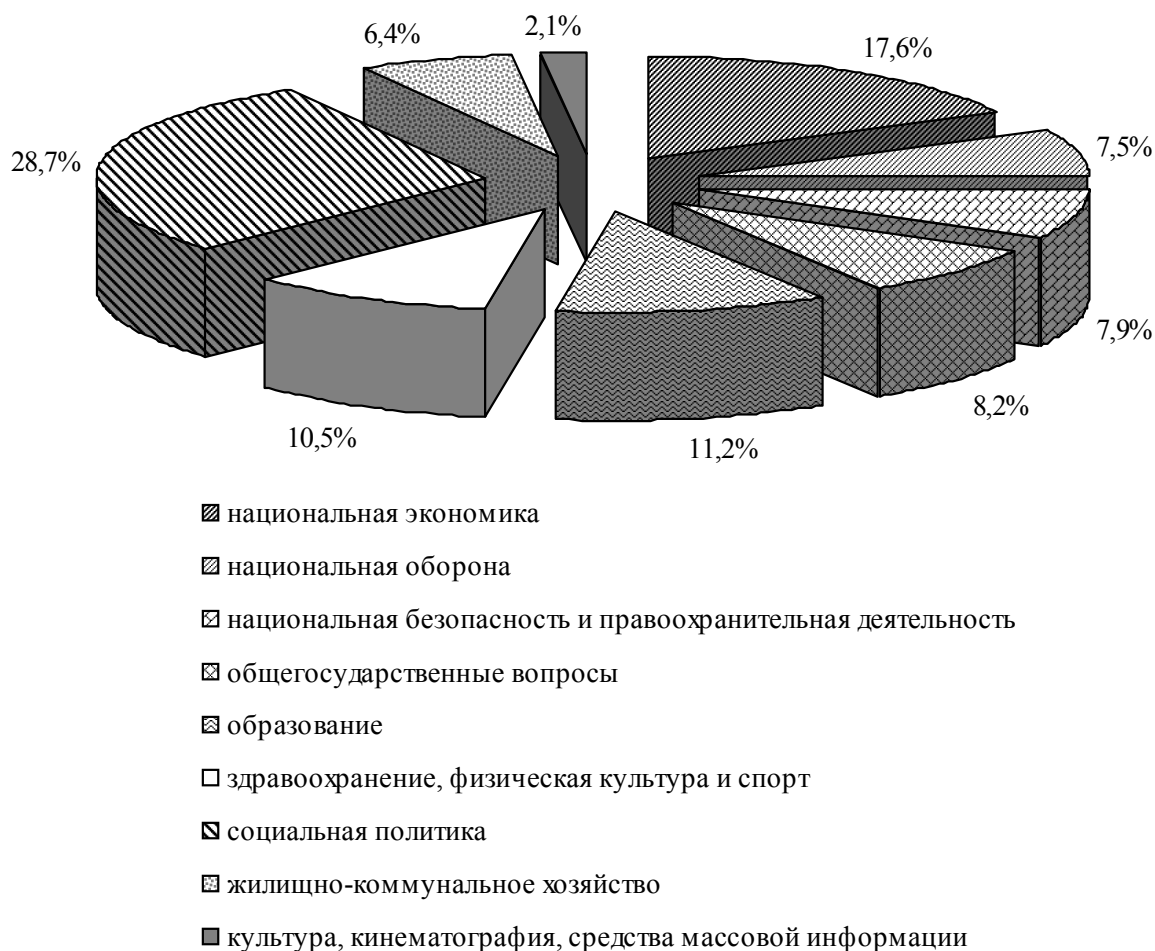
Рис. 2. Структура расходов консолидированного бюджета Российской Федерации в 2010 г. (диаграмма рассчитана и построена автором на основе данных информационно-аналитического раздела сайта Министерства финансов Российской Федерации ( http://info.minfin.ru/ ))

ляющих привлечь “длинные” деньги в отрасль, целью которых будет кардинальная модернизация и перестройка всей системы. При этом особое внимание следует уделить вопросам управления системой предоставления услуг жилищно-коммунального хозяйства с учетом сложившихся социально-экономических противоречий.