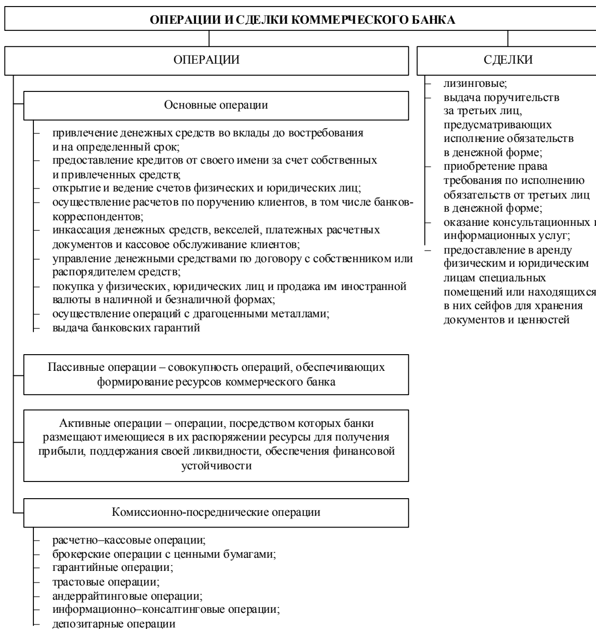
Рис. 2. Виды операций и сделок коммерческого банка

даж и получение прибыли от каждой инновации. Вторая пара определений отражает инновации, стимулированные рынком или законодательством страны, с одной стороны, и независимые инновации, внедренные без участия рынка или регулирующих органов - с другой. Независимая инновация возникает стихийно (незапланированно), зато большинство финансовых инноваций объясняется влиянием рынка или регулирующих органов (сберегательные продукты, взаимные фонды для открытия инвестиционных и пенсионных счетов и др.). Взаимосвязь между процессом появления инноваций и процессом их распространения объясняется, по мнению Э. Роджерса, тем, что “суть процесса распространения -