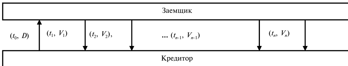
Рис. 2. Финансовые потоки в сложной кредитной операции

Для сложных финансовых операций, таких как долгосрочный кредит, важнейшей особенностью является наличие серии платежей погашения долгосрочного кредита, образующих финансовый поток. При этом в каждой такой кредитной сделке для определения финансовых потоков в качестве исходных параметров задается сумма выданного кредита D , срок сделки, процентная ставка по кредиту и схема его погашения. В конечном счете завершение сделки предполагает выплату всех сумм, предписанных условиями сделки.