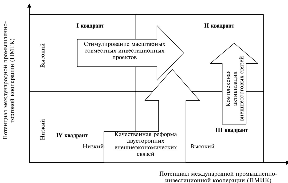
Рис. 1. Общий вид стратегической матрицы потенциала международной промышленной кооперации

С позиции эффективной организации международной промышленной кооперации России, по нашему мнению, важно, чтобы данные составляющие суммарного потенциала международной промышленной кооперации были в должной мере сбалансированными.