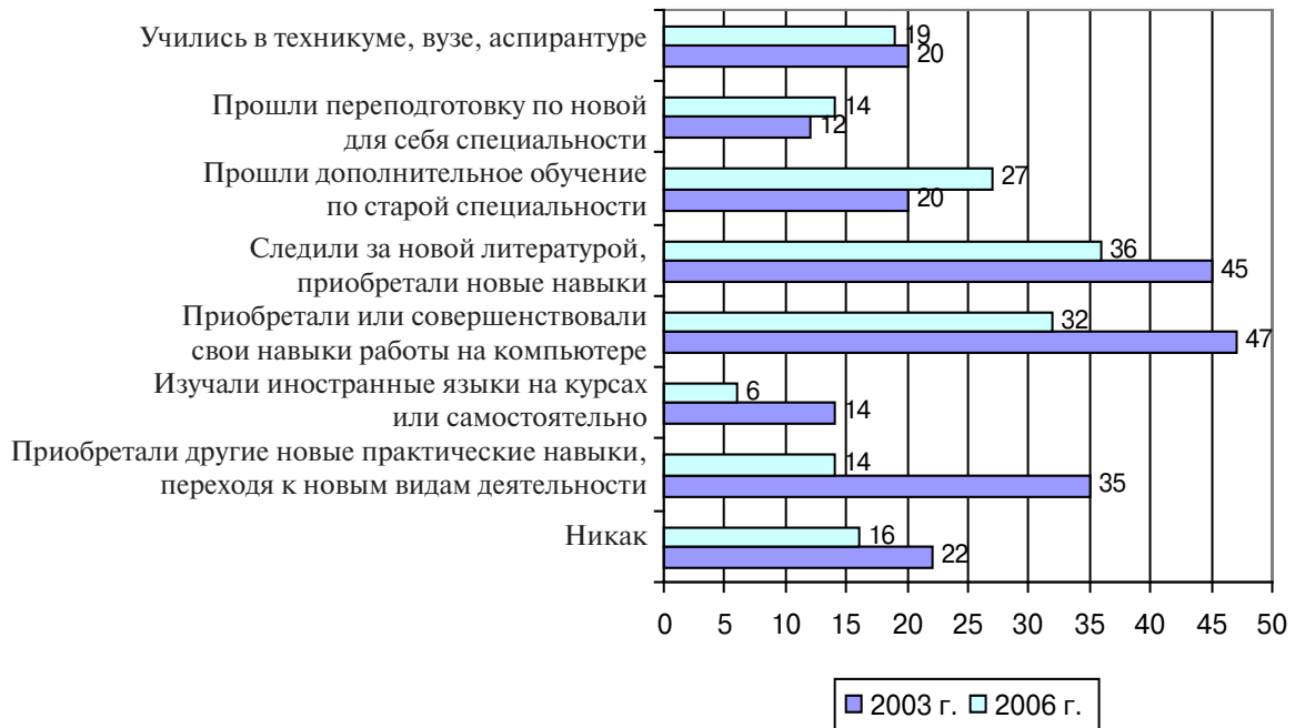
Рис. 3. Динамика ответов на вопрос «Как вы за последние три года пополняли свои знания?» 2003–2006 гг., %

работа помимо приобретения чисто профессиональных знаний и навыков позволяет: