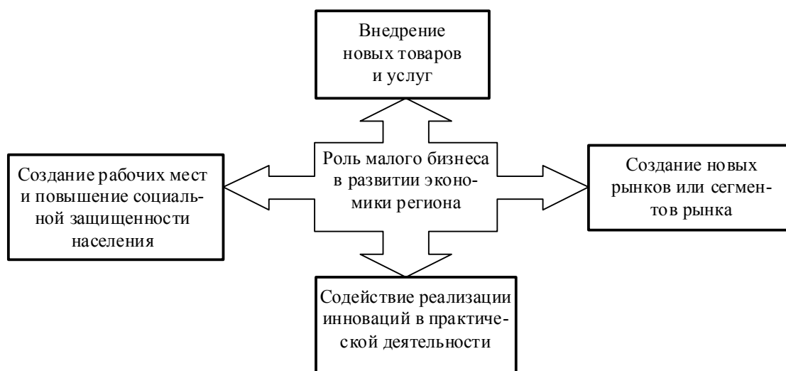
Рис. 1. Направления воздействия малого бизнеса на экономику региона