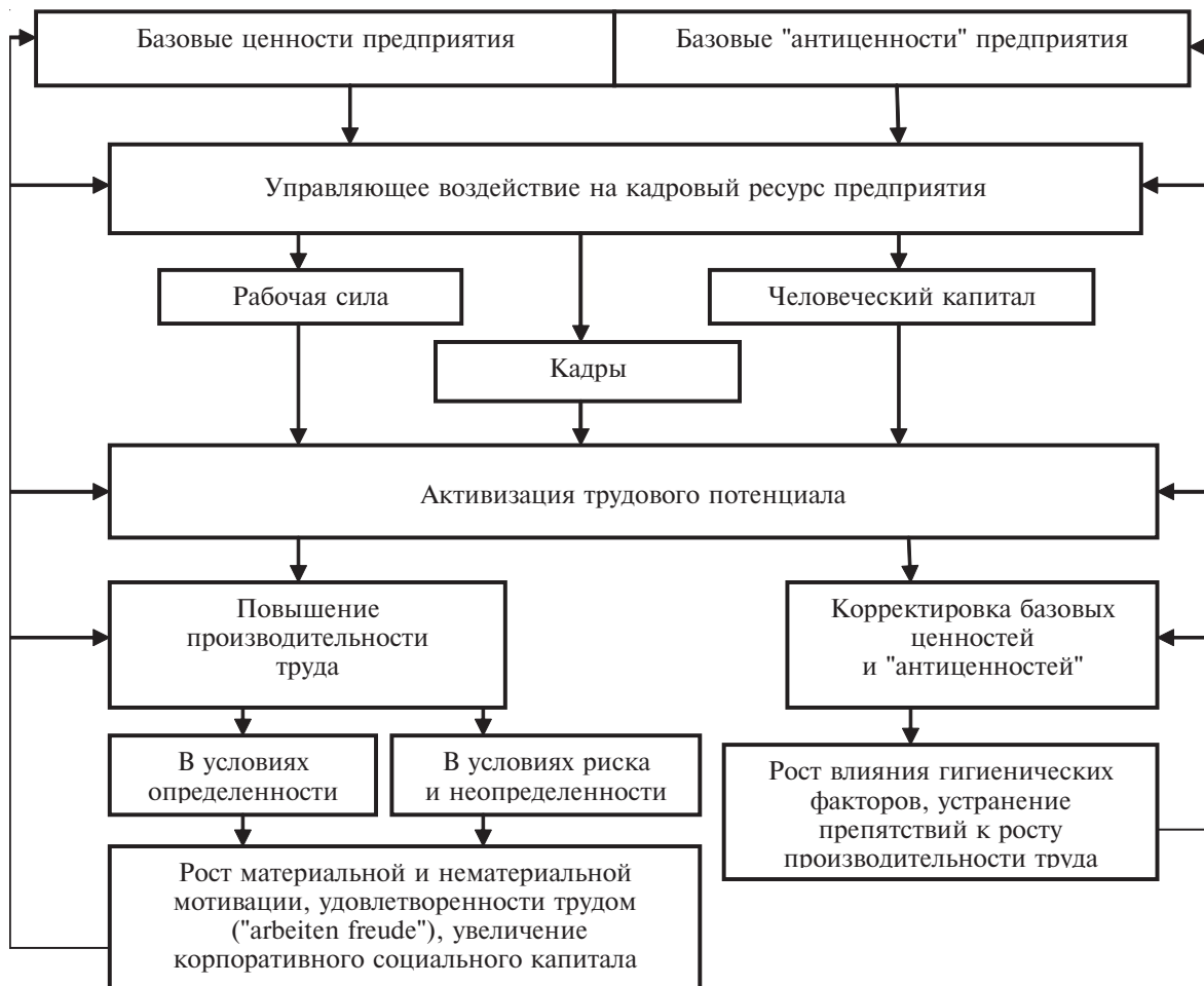
Рис. 4. Функциональная схема реализации социально ориентированного менеджмента на промышленном предприятии

вовлеченности отдельных работников в единую скоординированную деятельность предприятия, в рамках которой каждый работник достигает значимых для него личных целей.