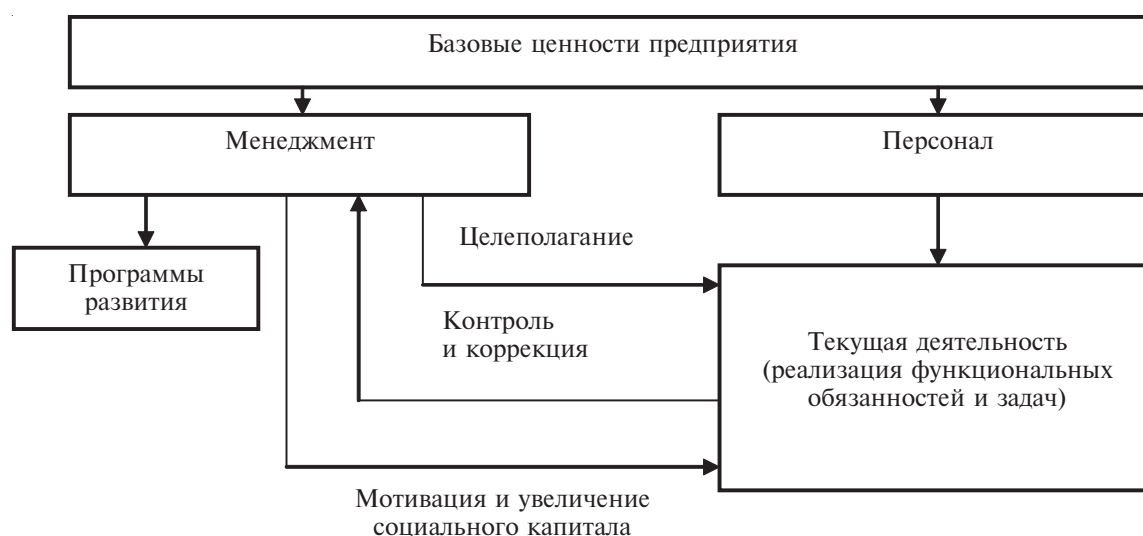
Рис. 3. Инновационная модель социально ориентированного менеджмента

Как видно из приведенной модели, базовые ценности предприятия являются основой его деятельности, позволяющей синхронизировать активность управляющей подсистемы (менеджмента предприятия) и управляемой подсистемы (персонала), создать предпосылки для роста социального капитала компании и увеличения роста