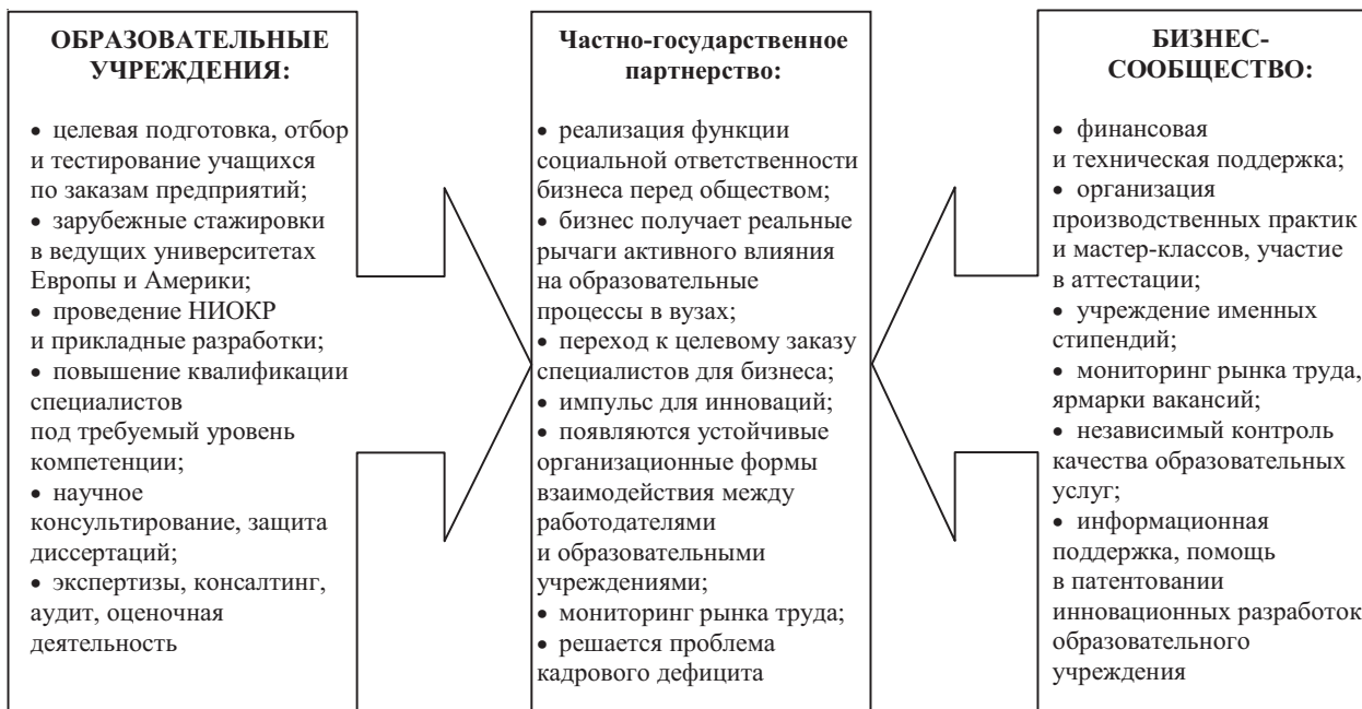
Рис. 1. Реализация частно-государственного партнерства по развитию системы образования Республики Татарстан

Поскольку доходы от эндаумента идут только на цели образования и срок их действия ог-