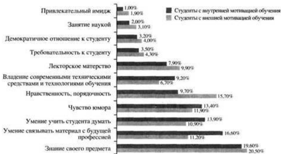
Рис. 1. Рейтинг качеств преподавателя в представлениях студентов

тальное отношение к высшему образованию, в исследовании ставилась задача сравнить мнения студентов с внешней мотивацией обучения (рассматривают учебу как средство для достижения других целей) и внутренней (видят в самом образовании ценность).