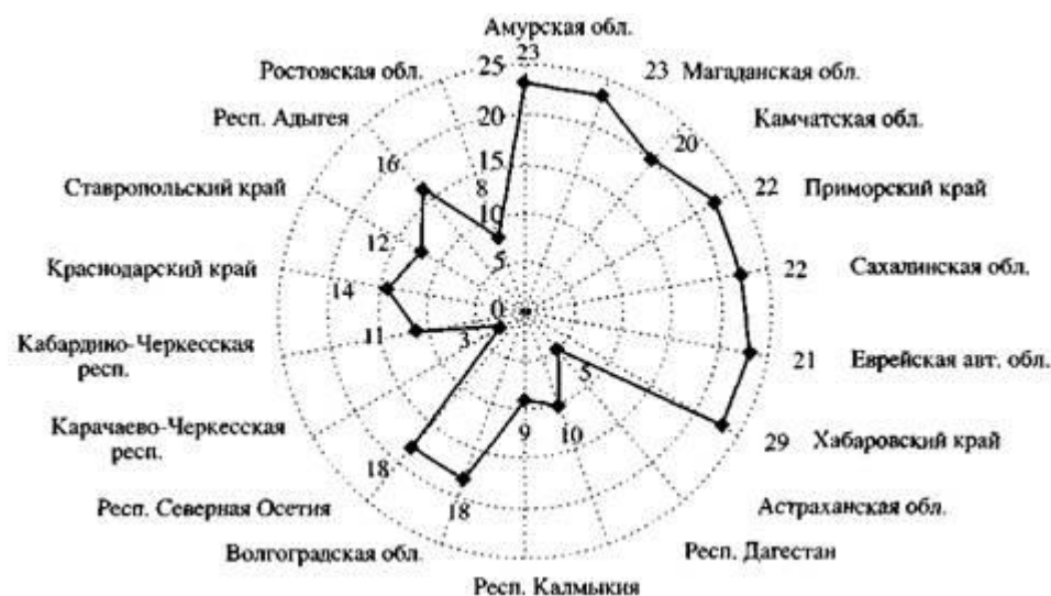
Рис. 2. Ранжирование фактора "этнические противоречия" по степени его значимости на рост социальной напряженности в субъектах Южного и Дальневосточного федеральных округов РФ

озный экстремизм, и шовинизм, и расизм. На Северном Кавказе это противостояние этнических, казачьих и религиозных общественных объединений друг другу, которое серьезно влияет на уровень социально-политической напряженности. Проблема радикализма и экстремизма на Юге России многоаспектна и разрешить ее можно только комплексно, сочетая экономические, политические, правовые и, в последнюю очередь, силовые меры.