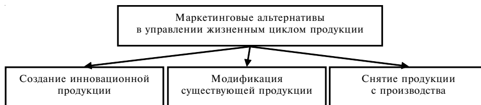
Рис. 1. Альтернативные пути маркетингового управления жизненным циклом продукции