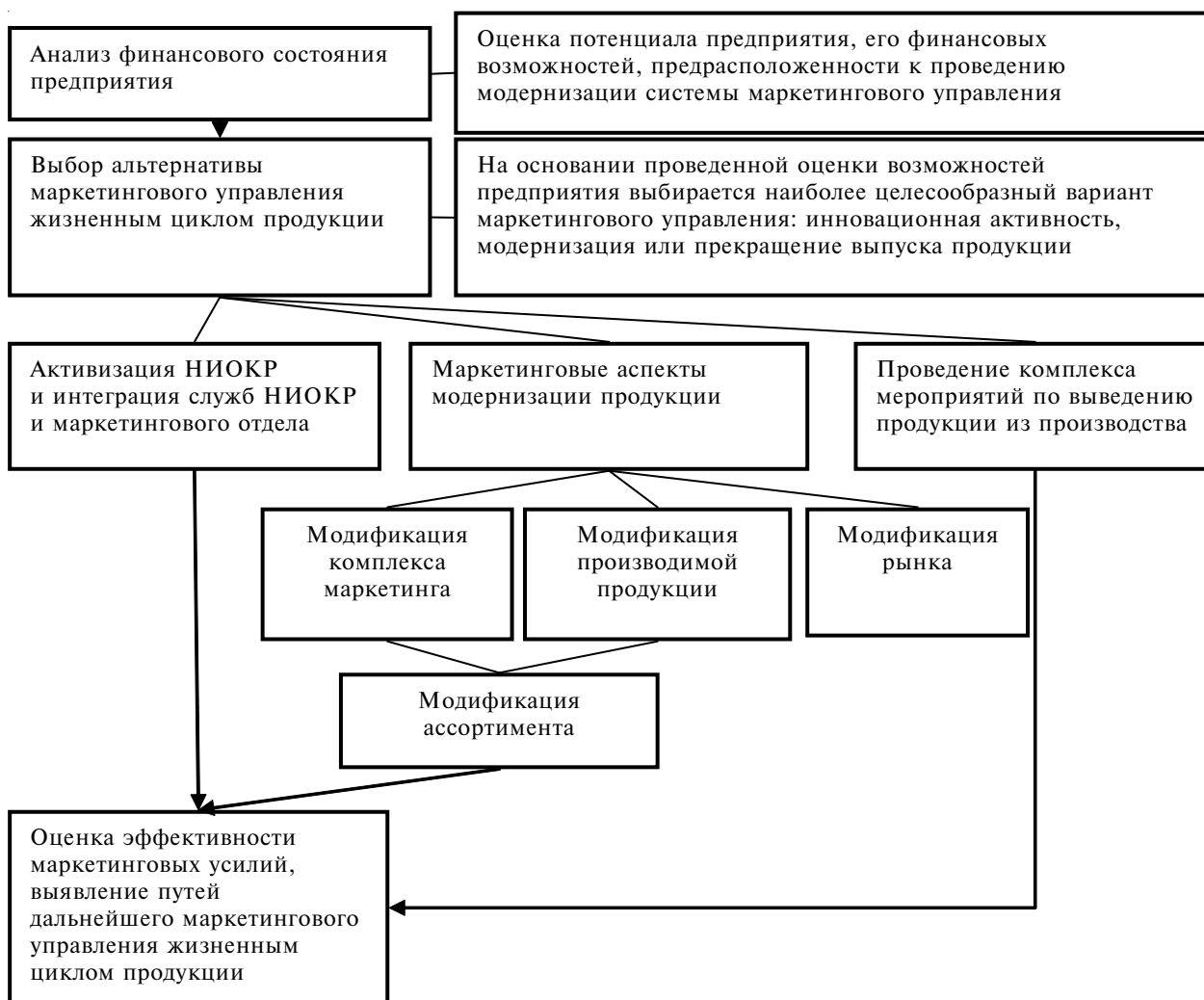
Рис. 4. Модель маркетингового управления жизненным циклом химической продукции

ходимо в максимальной степени интегрировать системы НИОКР, ответственные за модификацию существующих видов химикатов в систему маркетингового управления жизненным циклом продукции.