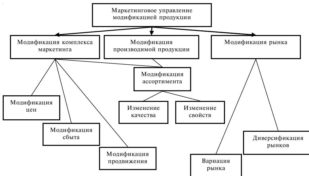
Рис. 2. Комплекс маркетингового управления жизненным циклом продукции в рамках ее модификации