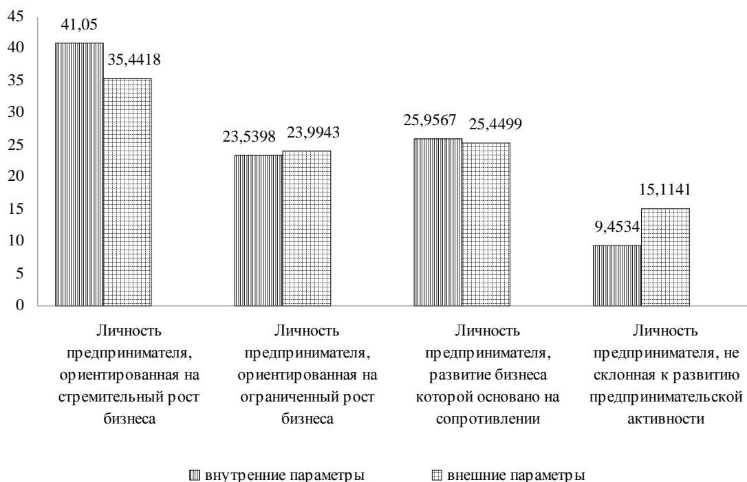
Рис. 3. Сравнительный вклад внутренних и внешних параметров в процесс формирования личности предпринимателя