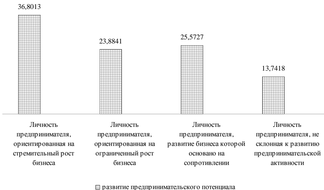
Рис. 4. Итоговое распределение альтернатив формирования личности предпринимателя

тию личности предпринимателя, ориентированной на активный рост, и личности предпринимателя, развитие бизнеса которой основано на сопротивлении. Внешние параметры в большей степени стимулировали развитие “осторожных предпринимателей”, ориентированных на ограниченный рост. Кроме того, внешние параметры в большей степени подавляли предпринимательскую активность, что проявляется в отказе