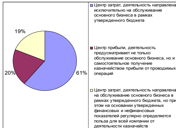
Рис. 3. Казначейство - центр прибыли или затрат

ровым тенденциям и позволяет повысить эффективность управления денежными средствами и финансовыми рисками компании.