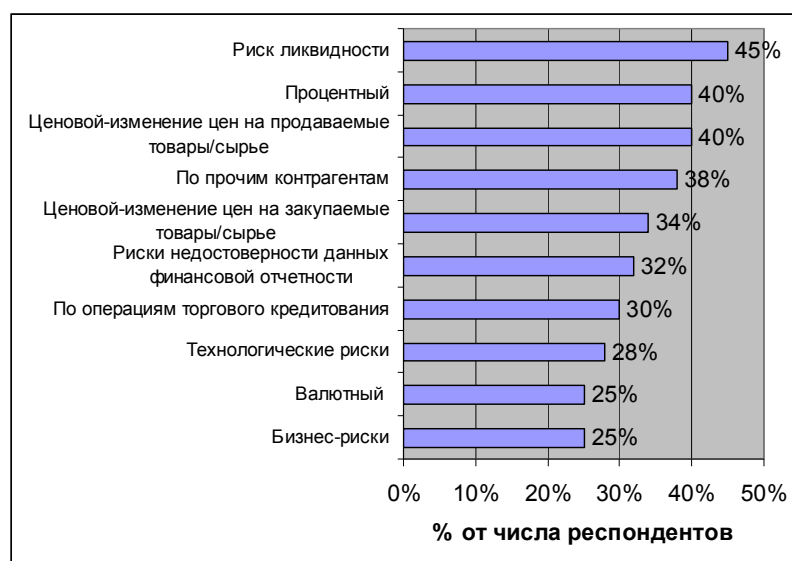
Рис. 1. Наличие в компаниях политик управления различными видами рисков

Централизация казначейской функции - закономерный процесс, который соответствует ми-