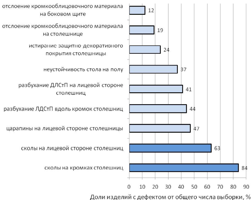
Рис. 3. Группировка дефектов на объектах выборки по частоте обнаружения:

■ - дефекты группы А; ■ - дефекты группы Б