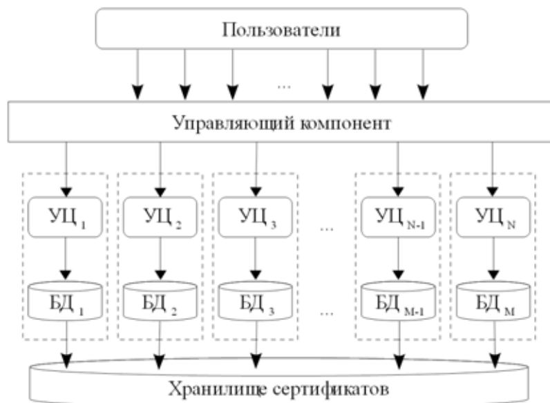
Рис. 1. Архитектура РКІ-системы высокой готовности

2. Показатели качества обслуживания заявок: