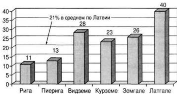
Рис. 2. Индекс риска бедности в Латвии и регионах в 2007 г. (%)

бедности на уровне медианного или менее 60% среднего дохода на одного жителя) и субъективный . Ни один из них не является безусловным, но при всех измерениях важны динамика, состав и социальная мобильность бедного населения. Оценивая социально-экономическое состояние территории, используют такой показатель, как "риск бедности", которому подвергаются все те, чьи доходы меньше 60% от среднего уровня доходов населения территории. В Латвии, в 2007 г. 21% жителей были подвержены "рisku бедности", а к исходу 2008 г. - уже 26% жителей*. Анализ показывает, что уровень бедности в Латвии имеет выраженные региональные различия. Так, наибольшее количество жителей, подверженных риску бедности, находится в Латгальском регионе, а наименьшее - в Рижском (см. рис. 2).