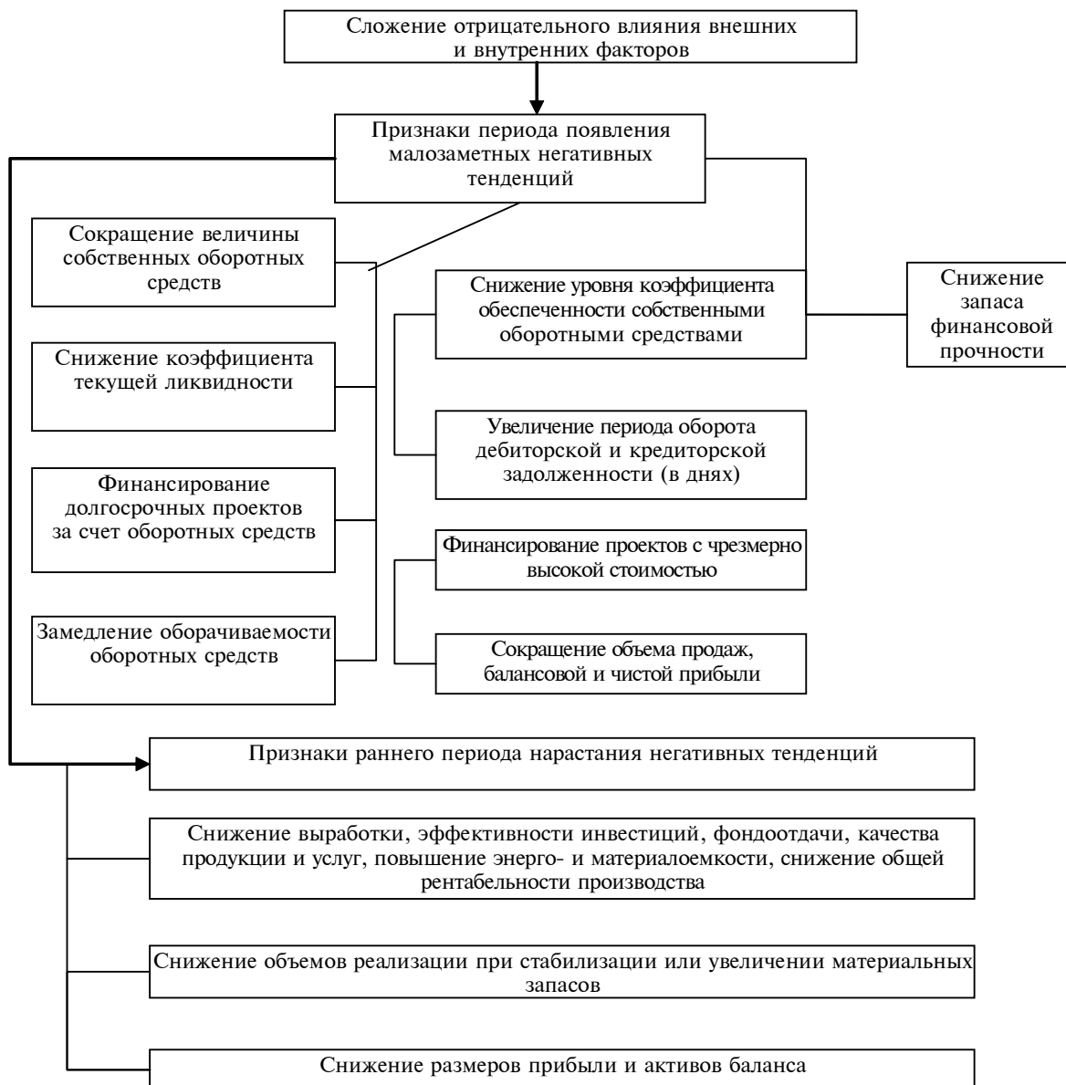
Рис. 2. Формирование негативных тенденций изменения внешней среды и их отражение в финансовых показателях промышленных организаций