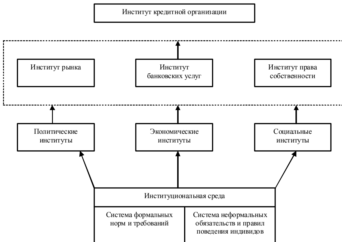
Рис. 1. Институциональная среда банковской деятельности

После описания возможных видов взаимодействия коммерческих банков с другими агентами рыночной экономики и их встраивания в рыночную систему рассмотрим основные харак-