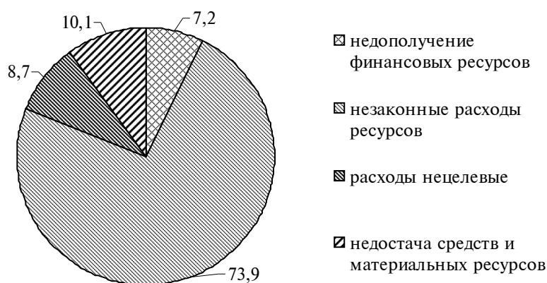
Рис. 2. Структура нарушений, приведших к потере финансовых и материальных ресурсов за 2010 г.