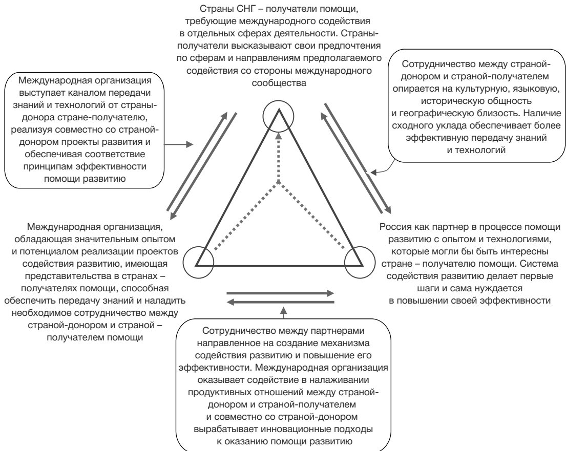
Рис. 1. Процесс трехстороннего сотрудничества

В каких же формах возможно сотрудничество российских институтов СМР с международными? Одним из вариантов является интегрирование трехстороннего сотрудничества для реализации совместных проектов страны-донора и международной организации на территории страны – получателя помощи (рис. 1).