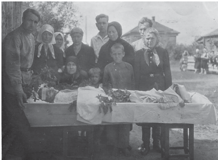
Рис. 5. 1946 г. Тамбовская область.