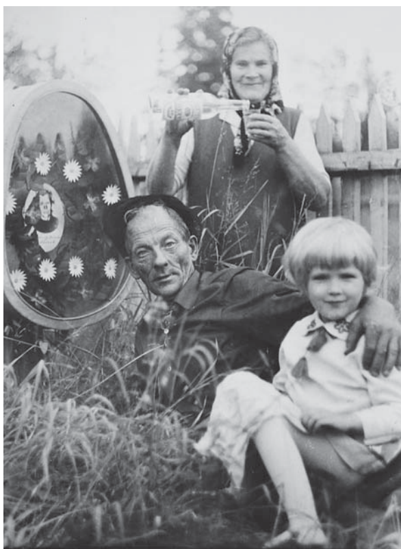
Рис. 3. Фотография из архива Кабинета фольклора СПбГУ № Dph08_Arch-Mez_02815. Архангельская обл., Мезенский р-н, Жердское с/п, Усть-Пеза. Переснята экспедицией филологического факультета СПбГУ в июле 2008 г.

Фотографии поминальных обрядов, совершаемых на могиле, нередко включают в качестве необходимой детали изображение еды и спиртного, причем участники обряда могут позировать фотографу, разливая водку по стопкам / стаканам или поднимая их (рис. 3). Этот застывший и нарочитый жест должен