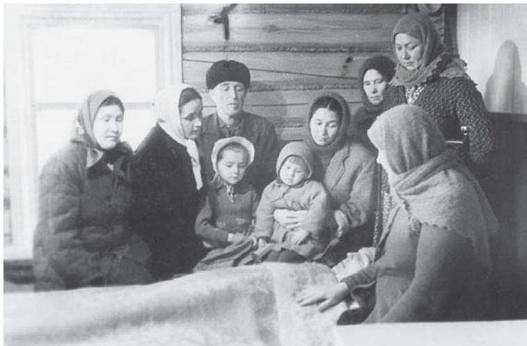
Рис. 2.

ни всякой, с одной стороны, с другой стороны, при желании можно наснимать хоть и смешно, это несложно: смешно снять похороны. Но понятно, что это не нужно делать, что нужно делать то, чего от тебя ждут люди. И исходя из этого интуитивного представления того, что они ждут, конечно, нужно фотографировать не тот момент, когда прикладываются ко лбу, а тот момент, когда человек стоит (Интервью с фотографом, который снимал похороны).