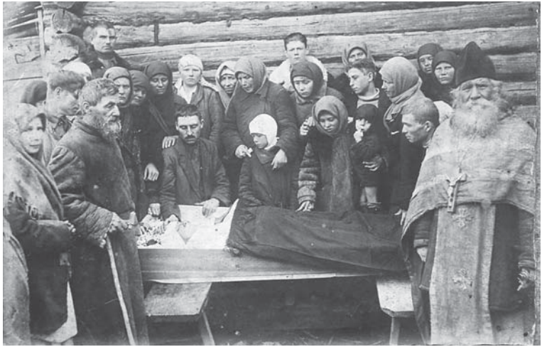
Рис. 1. Фотография из частного архива. 1932 г. Село Татарское под Минусинском.

Близкие покойного обычно выказывают скорбь, но на похоронных фотографиях, где они запечатлены у гроба, они не закрывают лицо руками, не прижимают к лицу платок, не рыдают и не демонстрируют глубокое отчаяние. Обычно знаком скорби на похоронных фотографиях является серьезное и печальное выражение лица.