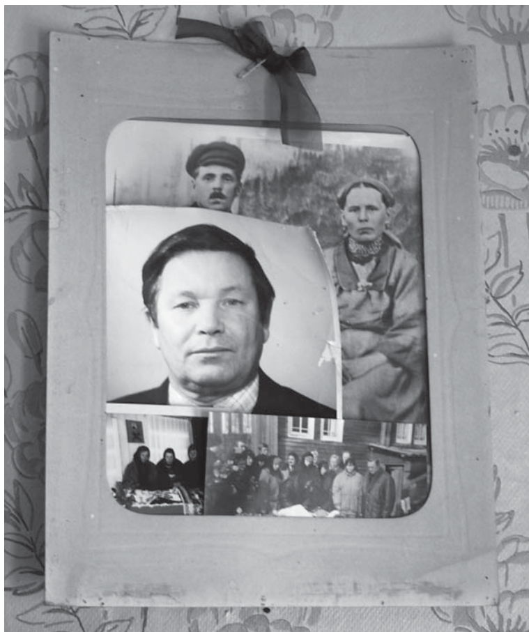
Рис. 4. Фотография из архива Кабинета фольклора СПбГУ № Dph08_Arch-Mez_02840. Архангельская обл., Мезенский р-н, Жердское с/п, д. Жердь. Переснята экспедицией филологического факультета СПбГУ в июле 2008 г.

деревни 1935 г.р. в одну рамку, специально оформленную с помощью черной ленты, помещены и фотографии людей при жизни, и снимки их похорон (рис. 4). Смерть воспринимается как закономерный итог жизни, и в деревенский альбом на одну страницу могут поместить фотографию еще живого человека при смерти и его же — уже в гробу (такую альбомную страницу участники фольклорной экспедиции Петрозаводского университета (рук. С.В. Федорова) в 2006 г. видели в альбоме жительницы д. Широкие поля Медвежьегорского района Карелии). Конечно, жанр такого собрания — семейный альбом, он чаще всего и встречается в сельской культуре, носители которой с помощью фотографий будут конструировать визуальную биографию скорее своей группы, малой или даже большой семьи, чем одного человека.