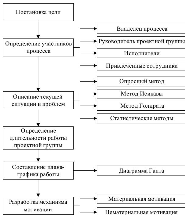
Рис. 2. Алгоритм решения задачи реализации процесса бюджетирования

мость стратегических целей, планирование, анализ, контроль, стимулирование, - представляя собой полноценный управленческий инструмент.