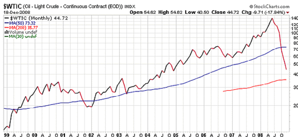
Рис. 2. Цена нефти за период с 1999 по 2009 г.