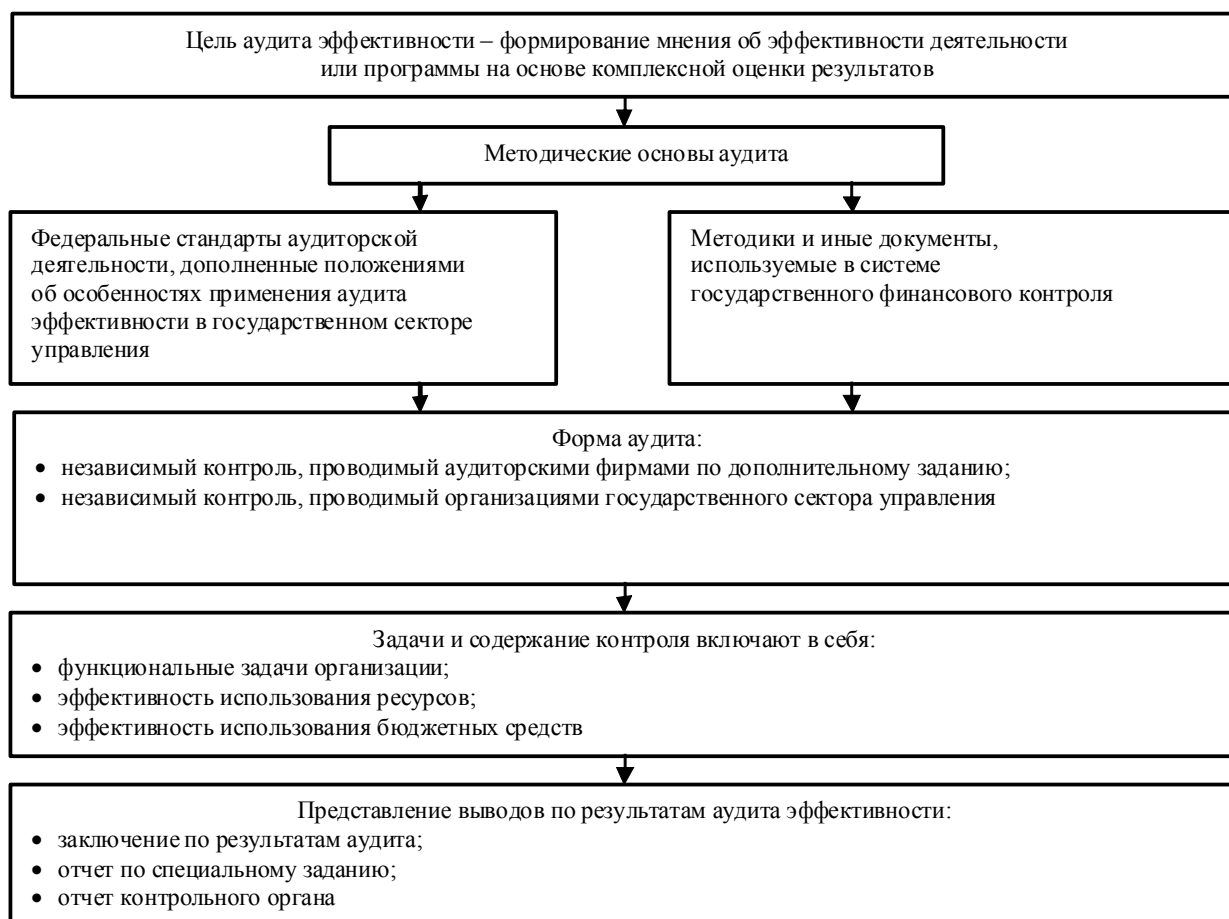
Рис. 4. Цель и методические особенности аудита эффективности организаций государственного сектора экономики

Государственный сектор экономики имеет ряд особенностей, оказывающих влияние на методику аудита эффективности (рис. 4).