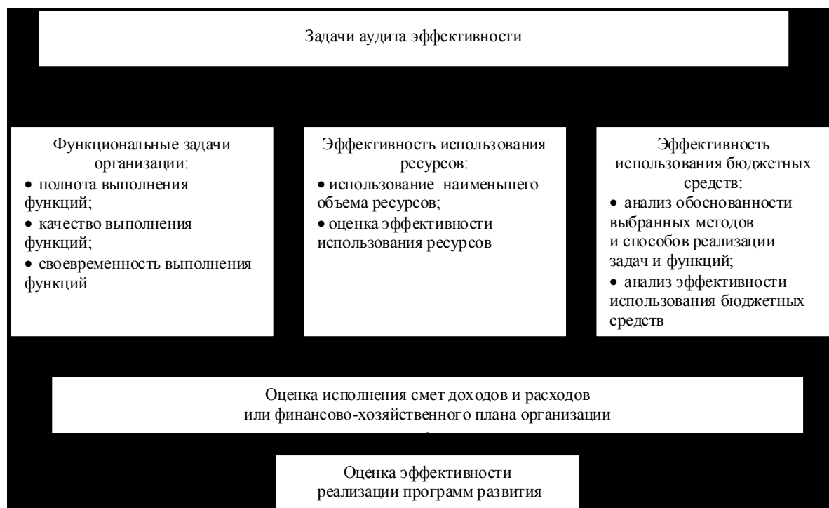
Рис. 1. Взаимосвязь задач аудита эффективности организаций государственного сектора экономики

тором аудит эффективности будет рассматриваться как самостоятельный вид аудита. Так появится возможность законодательного закрепления понятия “аудит эффективности”.