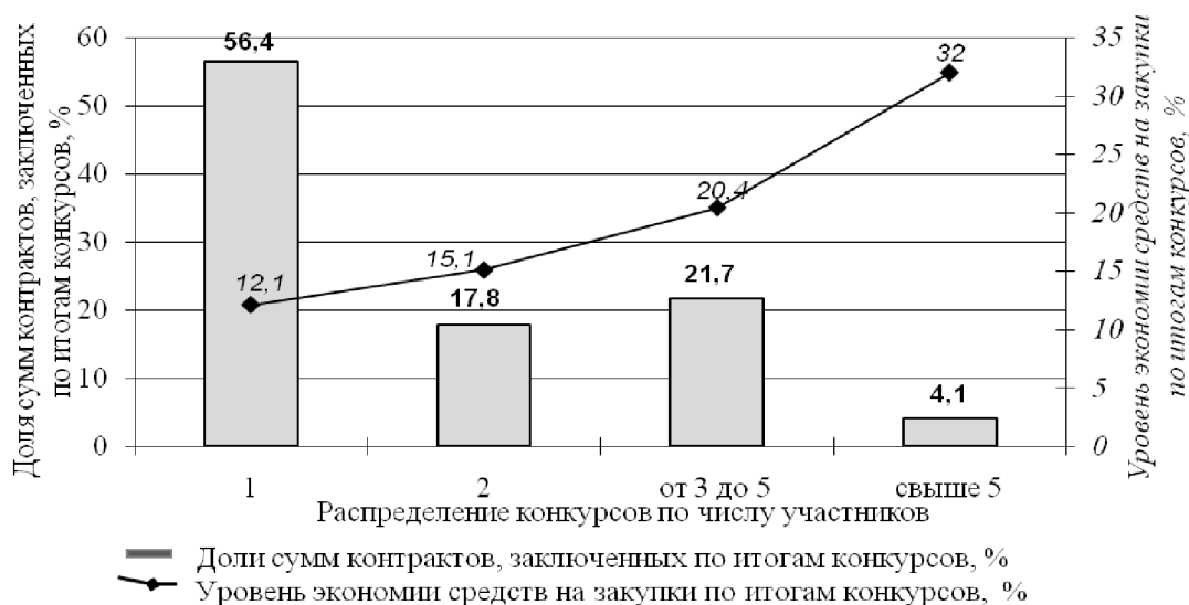
Рис. 1. Распределение сумм контрактов и полученной экономии средств в зависимости от количества участников конкурсов по закупкам мебели для нужд гос. учреждений в 2010 г.

Запросы котировок, хотя и рассматриваются как непрогрессивный способ закупок, на практике оказались наиболее выгодными для участников размещения заказов (рис. 3): только 11,6 % суммарной стоимости контрактов было зак-