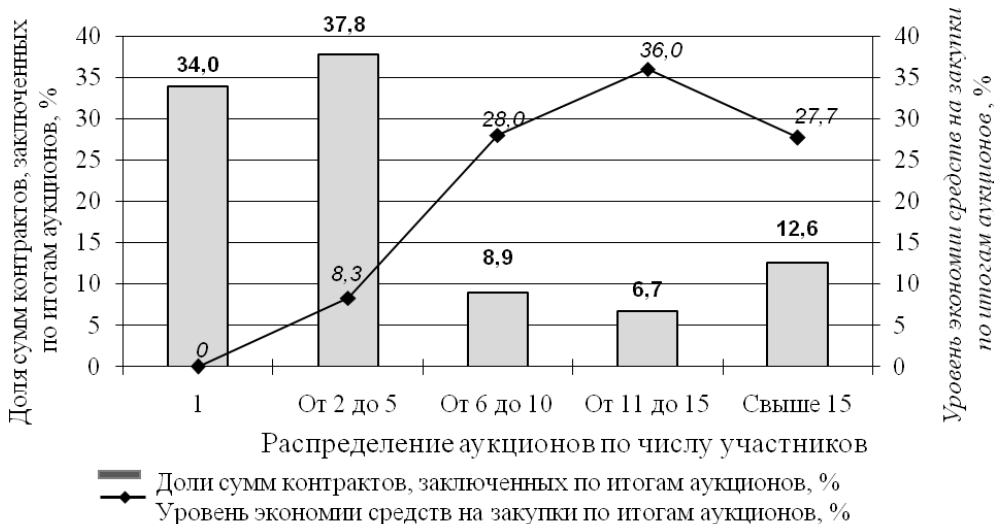
Рис. 2. Распределение сумм контрактов и полученной экономии средств в зависимости от количества участников аукционов по закупкам мебели для нужд гос. учреждений в 2010 г.