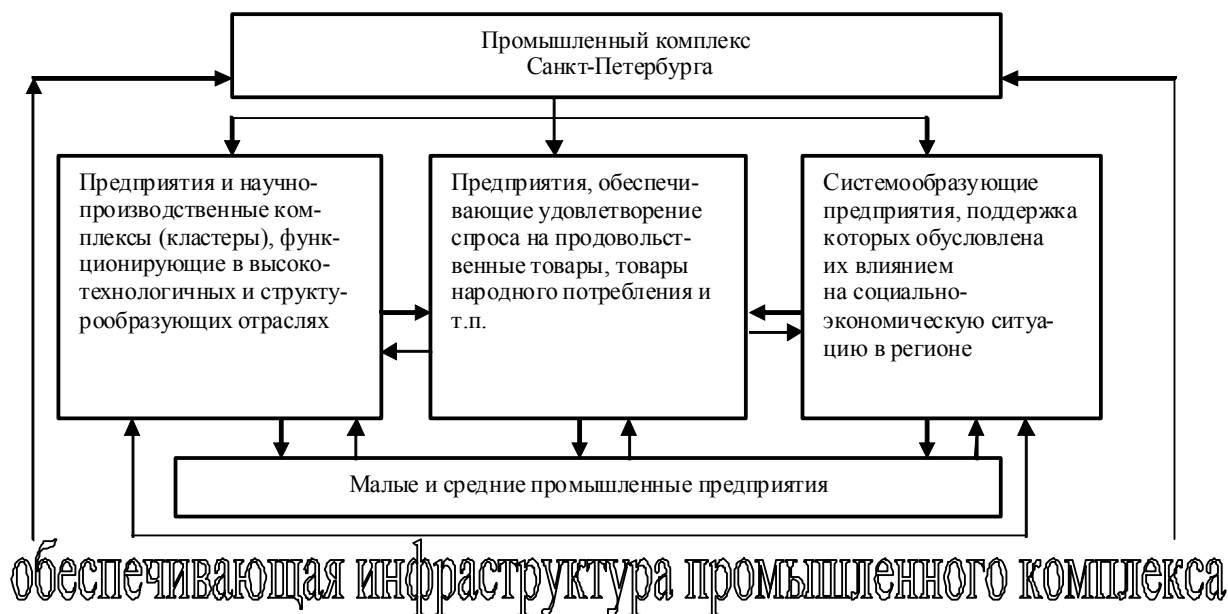
Рис. 3. Структура промышленного комплекса Санкт-Петербурга