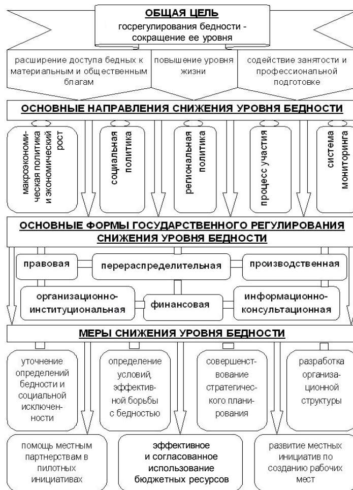
Рис. 2. Модель снижения уровня бедности в переходной экономике Российской Федерации и Республики Таджикистан

Как развитые страны, так и страны с новой переходной экономикой осуществляют меры по борьбе с бедностью населения. Государственная политика сокращения уровня бедности зависит, прежде всего, от достигнутого уровня социально-экономического развития страны и степени неравенства в распределении ресурсов. Правительство РФ и “новых европейских” стран связывают стратегии, направленные против бедности, с общими планами развития (например, делая акцент на