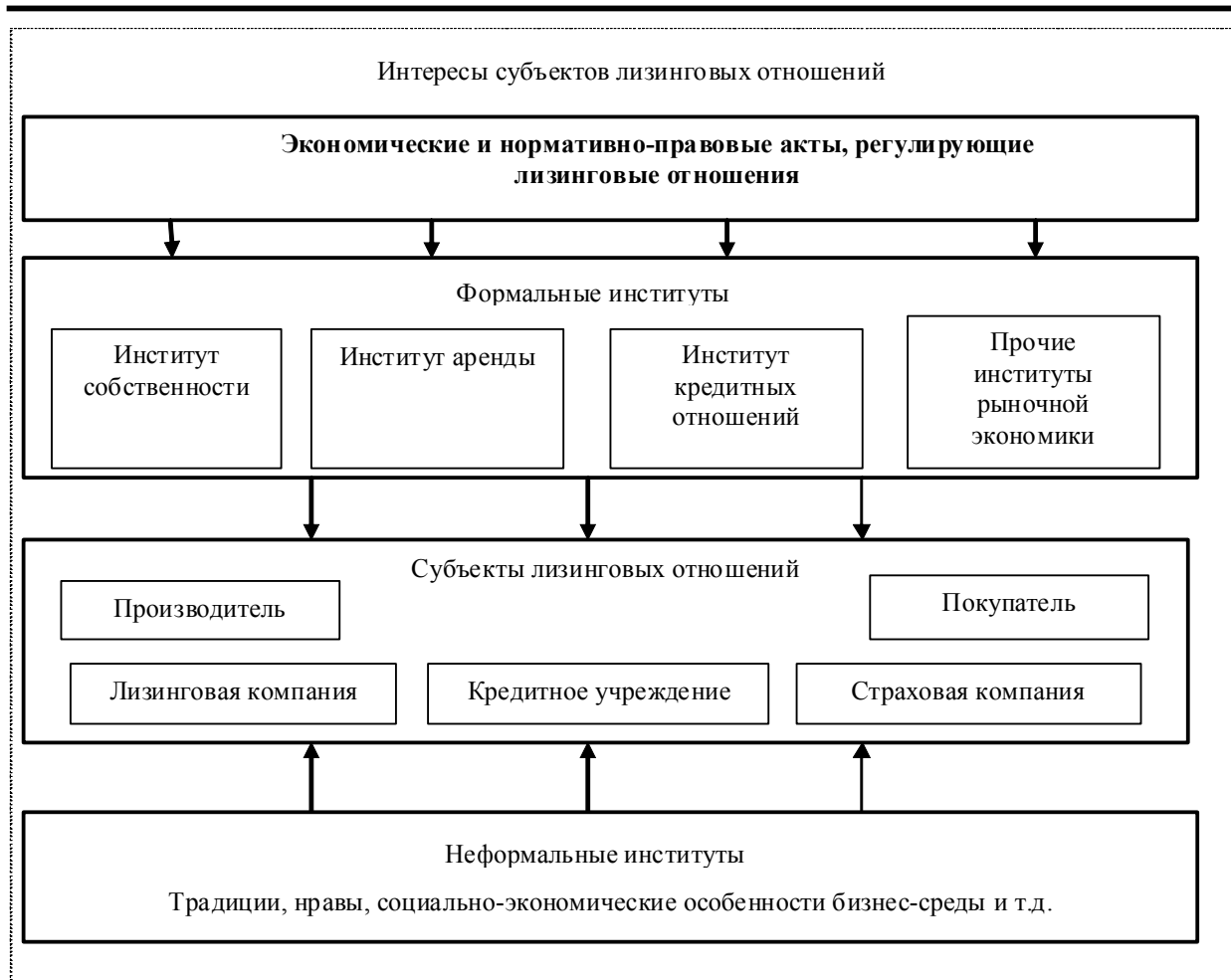
Рис. 2. Институциональная модель лизинговых отношений

Институциональное соглашение - это контрактное отношение или структура управления, объединяющая хозяйственные единицы и определяющая способ их кооперации и (или) конкуренции. Контракт - соглашение, добровольно заключаемое его сторонами и координирующее их действия путем определения взаимных прав, обязательств и механизмов их соблюдения 7 . Основным финансово-правовым документом, определяющим порядок и условия осуществления лизинговой сделки, является контракт лизинга. Контракт лизинга и другие, связанные с ним договоры, образуют институциональные соглашения. В зависимости от условий контракт может включать различные разделы. Однако наиболее существенным являются следующие: стороны контракта: лизингодатель, лизингополучатель, производитель - продавец; предмет контракта (объект лизинга, его наименование, количественные и качественные характеристики); срок действия контракта лизинга; права и обязанности сторон; условия лизинговых платежей; страхова-