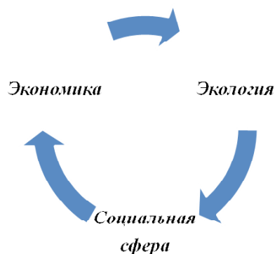
Рис. 1. Экономико-социально-экологическая сфера

По мнению специалистов, взаимодействие общества с природой всегда отражается на экономике, культуре, нравственной атмосфере общества и, как следствие, закономерно отразится на политике. Предполагается, что человек существует на пересечении трех сфер: экологической, экономической и социальной (рис. 1). Чем силь-