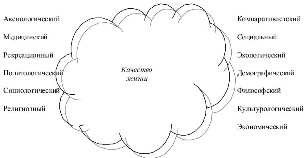
Рис. 2. Подходы к проблеме качества жизни

С начала 70-х гг. XX в. в развитых странах мира наступила новая фаза развития производи-