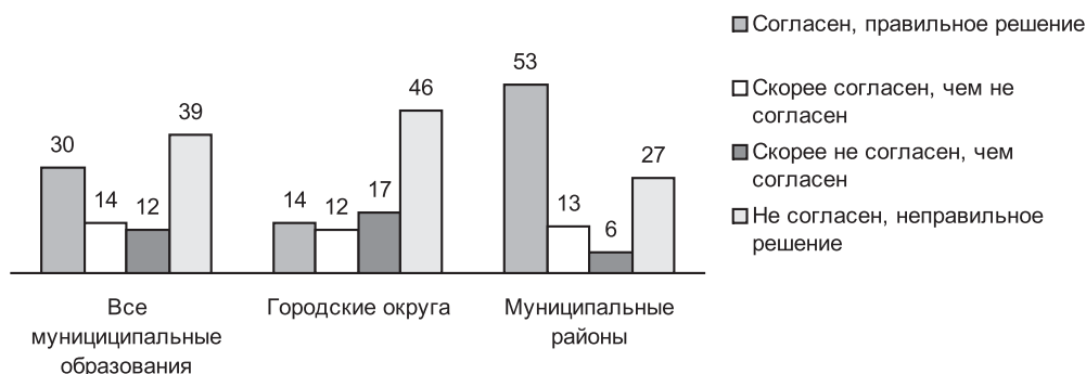
Отношение глав городских округов и муниципальных районов к инициативе о переносе срока вступления в силу закона, %