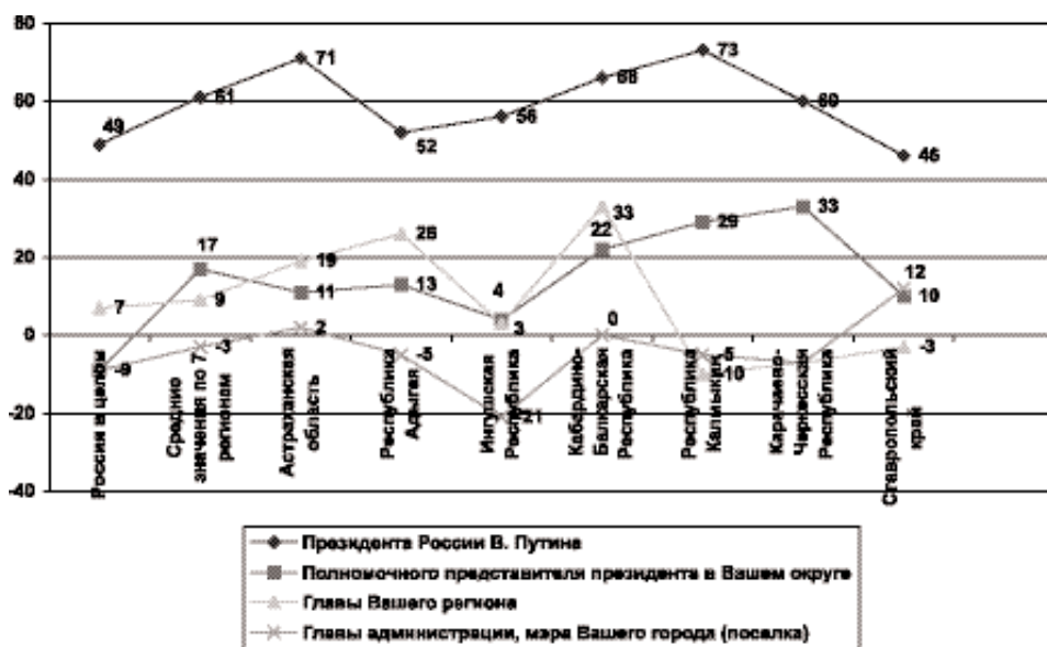
Рисунок 1 Индексы... «Вы в целом одобряете или не одобряете деятельность...», % (данные по 7 регионам Южного федерального округа и по России)

В последнее время власть часто выступает с различными политическими инициативами. Из трех инициатив власти — монетизация льгот, изменение системы выборов глав регионов и укрупнение регионов — среди