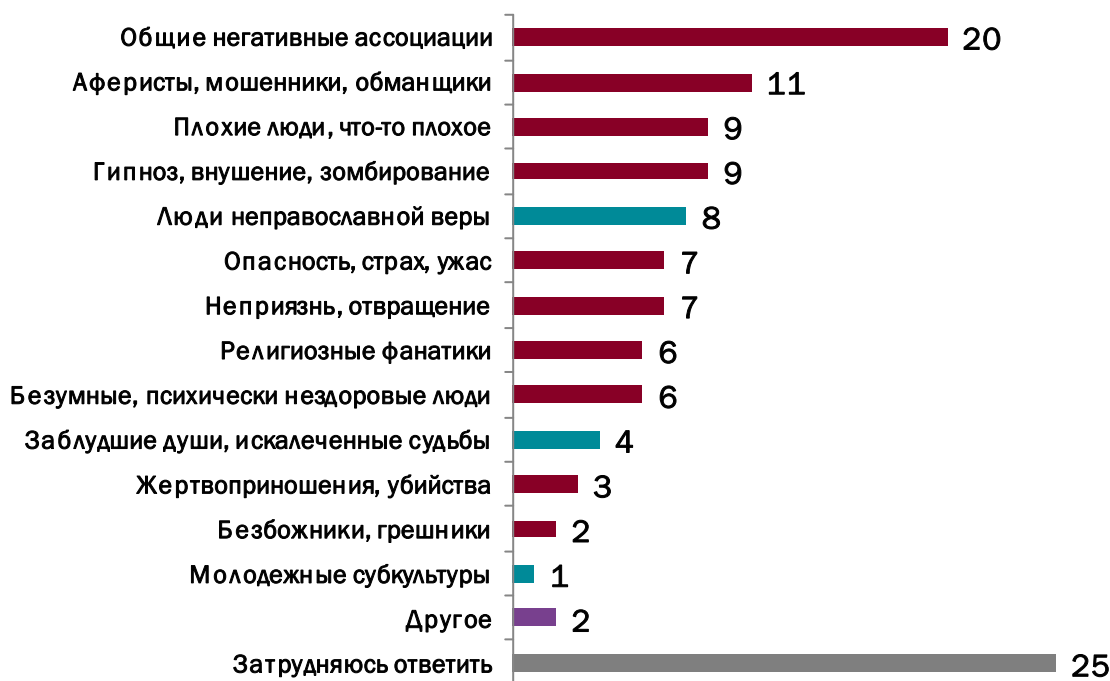
Рисунок 3 – Ассоциации со словами «секта», «сектанты» (%)

Не имеющие негативной окраски ассоциации приходят в голову 13% респондентов: 8% говорят о сектантах как о людях неправославной веры, 4% считают их заблудшими душами, 1% — приверженцами молодежных субкультур. Подобные ассоциации чаще свойственны людям, имеющим представителей сект в кругу общения: заблудшими душами их считают 11% в среднем по выборке против 3% тех, кто с состоящими в секте не знаком.