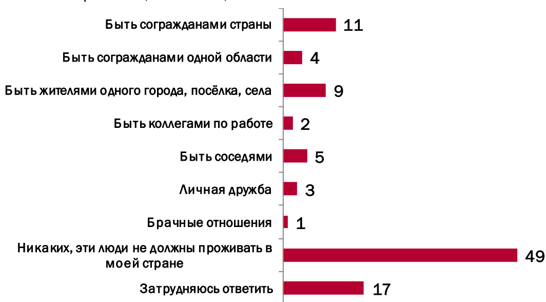
Рисунок 2 – Социальная дистанция между россиянами и сектантами (доли опрошенных, допускающих те или иные отношения с людьми, состоящими в религиозных сектах), %

О негативизме в отношении религиозных сект и их членов свидетельствуют также данные об ассоциациях, возникающих по поводу сектантов, и о том, какую дистанцию россияне считают приемлемой с представителями сект. Выяснилось, что каждый второй респондент не хотел бы иметь с представителями религиозных сект ничего общего, вплоть до отказа от совместного проживания в одной стране (рис. 2). Тех, кто готов на взаимоотношения, около трети (34%). На близкие отношения с ними в целом готовы 10% опрошенных: в качестве коллег их могли бы принять 2%, в качестве соседей — 5%, друзей — 3%, супруга/супруги — 1%. Еще 4% допускают, что представители сект могут проживать с ними в одном регионе. Наиболее приемлемые отношения с людьми, состоящими в религиозной секте, по мнению россиян, — жители одной страны (11%) или одного города (9%). Наименьшая социальная дистанция обнаружилась среди тех опрошенных, у кого в среде близких есть сектанты. Иными словами, те, кто имел дело с сектантами, относятся к ним с меньшей неприязнью, нежели те, кто только слышал о них.