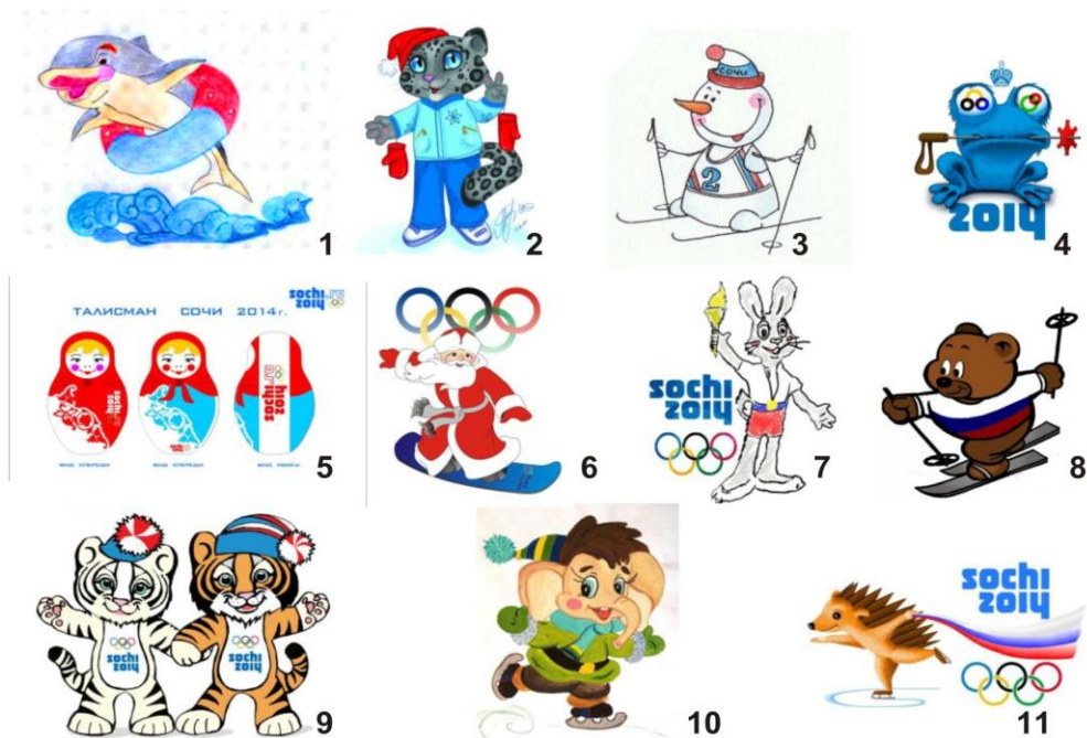
Рисунок 4 Варианты талисманов Олимпиады в Сочи