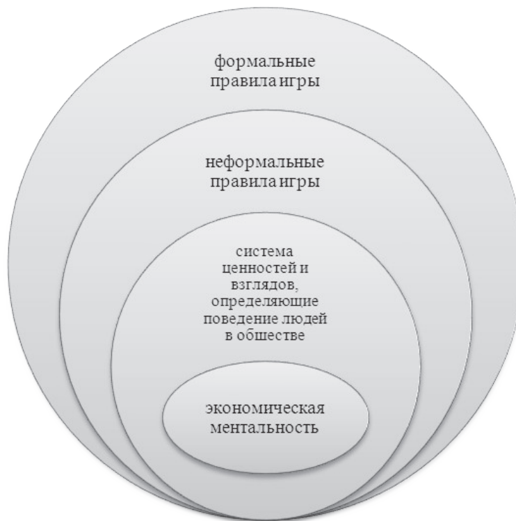
Рис. 1. Структура института

ментальности как базовому неформальному институту, который определяет как неформальные, так и формальные институты, а также обеспечивает вектор взаимодействия и стратегию реформирования социально-экономической системы (см. рис. 1).